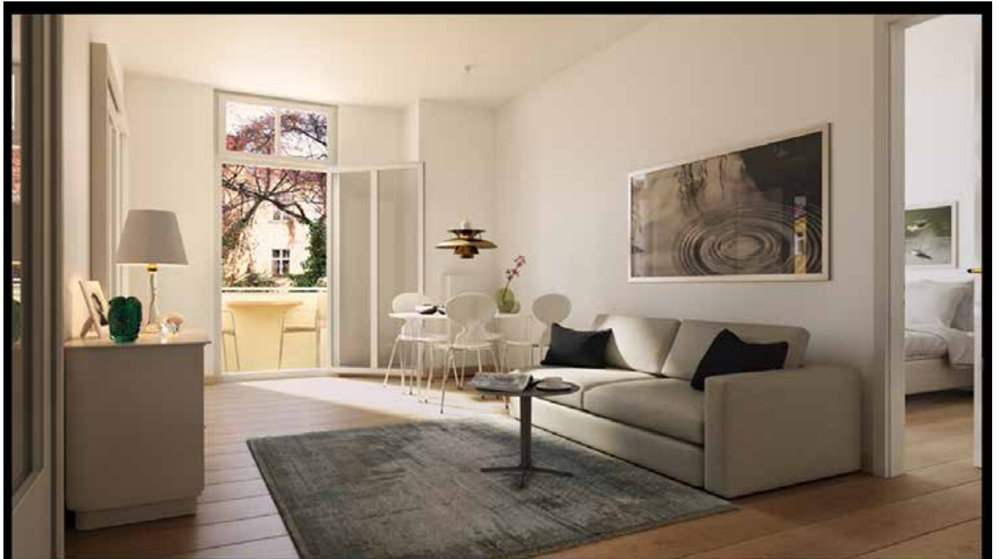
Finale 3D Visualisierung einer zwei Zimmer Wohnung in Berlin Prenzlauerberg, farbig, möbliert

3D Visualisierung einer 2-Zimmerwohnung auf Basis von Fotos und einer Grundrisszeichnung